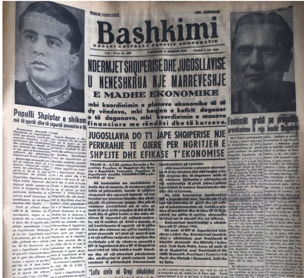
Ballina e gazeta 'Bashkimi' e 11 dhjetorit 1946

Njoftimi u dha me vonesë më 11.XII-1946 në gazetën ‘Bashkimi’ (foto nr.2).